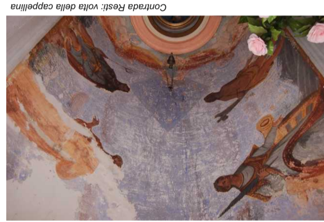
Contrada Resti: volta della cappellina