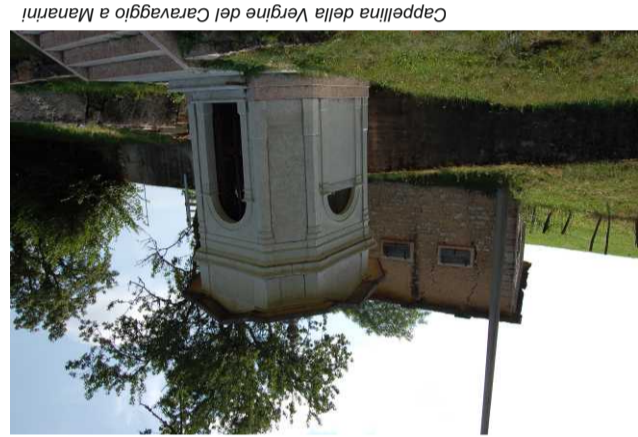
Cappellina della Vergine del Caravaggio a Manarini

Partendo dal cortile antistante al Palinthe si attraversa il centro di Erbezzo fino alla piazza della farmacia; quindi, si svolta a destra seguendo l'indicazione per contrada Melotti, piccolo nucleo ormai inglobato nel paese, ove sono ancora presenti alcune caratteristiche stalle in pietra. Nella contrada si scorgono le indicazioni bianco/verde che segnalano il proseguo del percorso in direzione dell'abitato di Teldari, antico topónimo di origine cimbra. La contrada è composta di tre insediamenti posti alla confluenza di brevi vallate. L'itinerario ora s'inoltra in una bella faggeta mista all'uscita della quale ci si trova tra i prato-pascoli di località Scaldi. Recenti interventi di ristrutturazione dei fabbricati hanno ridato splendore a questa caratteristica contrada da cui si ha di una stupenda visuale sul medio e basso Vajo dell'Anguilla. Si sale ora lungo la strada di accesso alla contrada, attraversando le località Rucchio e Resti. In quest'ultima si può osservare un caratteristico capello affresco, edificato dagli abitanti a ringraziamento per aver superato un'epidemia di colera avvenuta nel 1837. Il percorso termina salendo lungo la strada asfaltata che da Resti raggiunge il Palinthe.