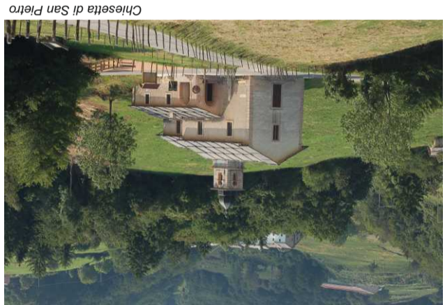
Chiesetta di San Pietro

Dopo aver attraversato il capoluogo, si devia verso la schiera di nuove case edificata in località Campagna. Attraversata la circonvallazione, si imbocca il sentiero che scende verso contrada Giodi. Il percorso dapprima si snoda attraverso del prati e poi si addentra in un bosco misto di faggio e carpino nero. Subito si può ammirare la lapide ottocentesca che ricorda la tragica morte di Vincenzo Mainenti. Il percorso, delimitato da un muro in pietra a secco, raggiunge quindi Giodi, pittoresca località situata all'apertura di una piccola valle: proseguendo verso Ragazzini, si attraversa un piccolo boschetto, luogo di una presunta apparizione mariana a tre fanciulli nel 1871. Arrivati a Ragazzini si continua lungo la strada fino a un tornante, dove a sinistra il percorso scende verso Staffor. Questa località dal topónimo cimbro, presenta diversi edifici in pietra di notevole fattura e una curiosa stele datata 1797; proseguendo lungo la strada si raggiunge la chiesetta di San Pietro, con un bel porticato e una stele seicentesca su un lato. A fianco dell'oratorio il sentiero sale verso Manarini, dove all'altezza di una particolare edicola ortogonale il percorso riprende a salire in direzione di Erbezzo.